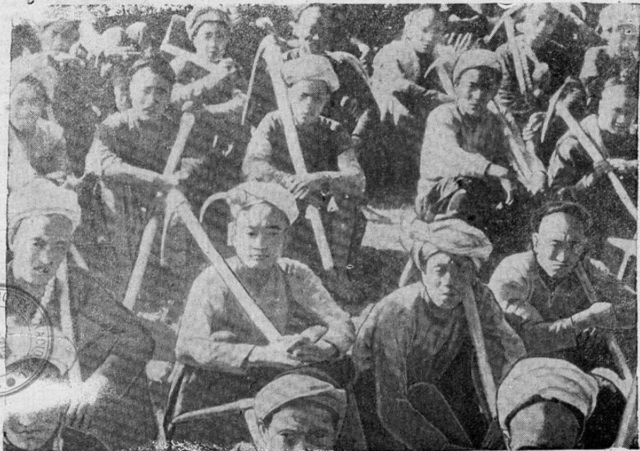
Tribus de chinos de la provincia occidental de Sikiang gozan de merecido descanso después de haber trabajado en la construcción de un camino que una a su patria con la India, ya que el camino de Birmania ha sido bombardeado.